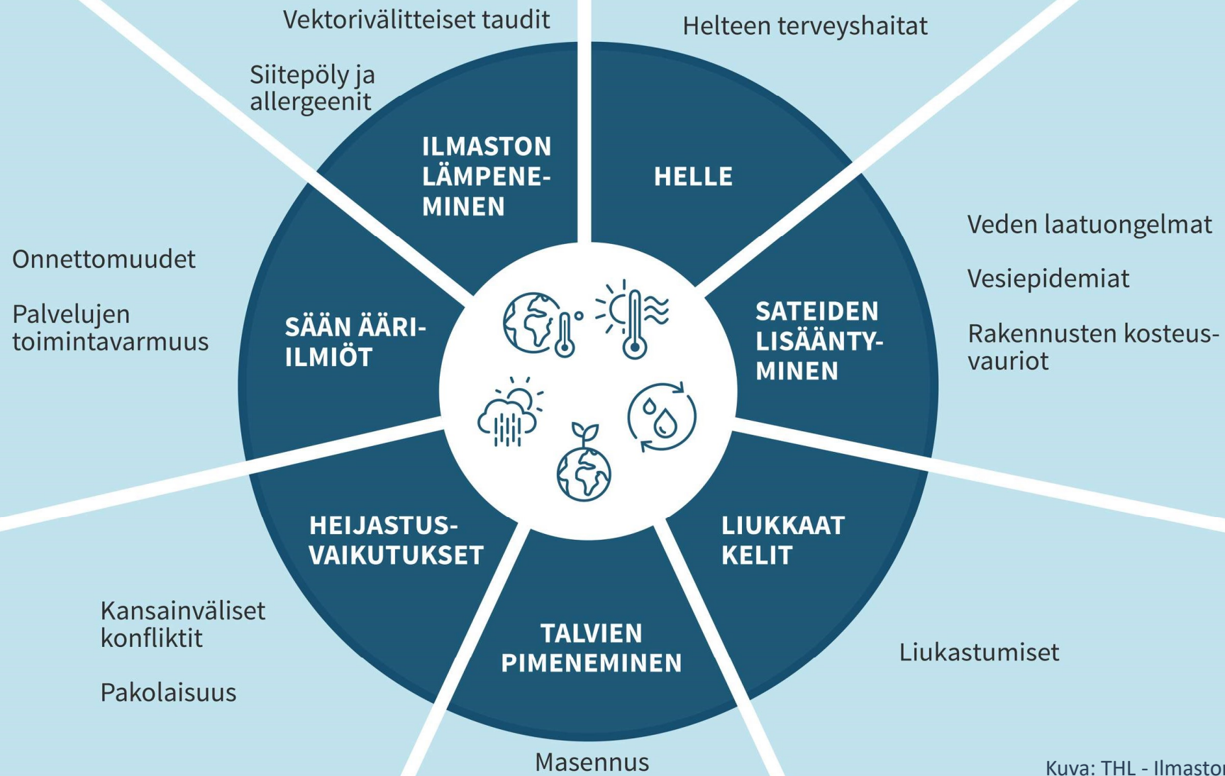
Kuva: THL - Ilmastonmuutos