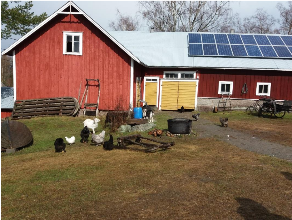
Kuva: Aavakertun kotitalan pihapiiriä. Tila pyrkii omavaraisuuteen lihan, maidon, munien ja sähkön suhteen.

Illasta tutustuimme yritykseen Meribjörkö , joka tarjoaa majoitus-, kokous-, ja ohjelmapalveluita Unescon maailmanperintökohteessa Merenkurkun saaristossa. Yritystoiminnan etuja alueella on kasvava matkailu saaristossa, uhkia puolestaan maankäyttöön liittyvät asiat ja ilmaston lämpeneminen ja sen myötä talviolosuhteiden heikkeneminen. Osa porukasta kävi illan aikana myös Saltkaretin näkötorjissa katselemassa miltä maankohoaminen ja merenpohjan paljastuminen näyttää ylhäältä käsin. Talviturkitkin taisi suurin osa mereen heittää!