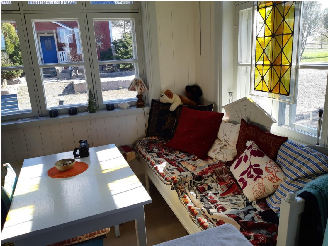
Kuva: Toiskan Voimala on upea kokous- ja oleskelutila.