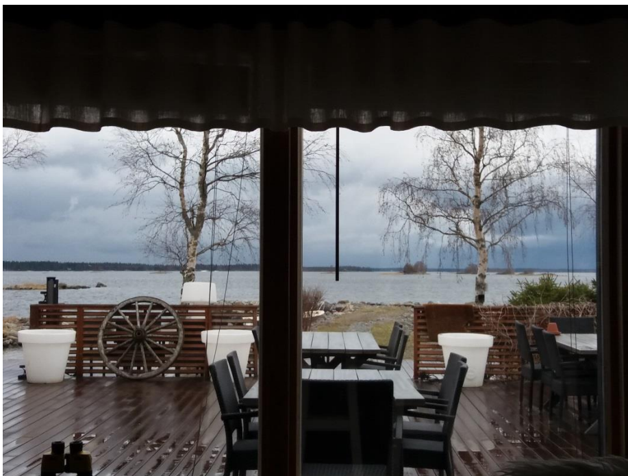
Kuva: Näköala Meribjörkön kokoustilasta.

Illasta tutustuimme yritykseen Meribjörkö , joka tarjoaa majoitus-, kokous-, ja ohjelmapalveluita Unescon maailmanperintökohteessa Merenkurkun saaristossa. Yritystoiminnan etuja alueella on kasvava matkailu saaristossa, uhkia puolestaan maankäyttöön liittyvät asiat ja ilmaston lämpeneminen ja sen myötä talviolosuhteiden heikkeneminen. Osa porukasta kävi illan aikana myös Saltkaretin näkötorjissa katselemassa miltä maankohoaminen ja merenpohjan paljastuminen näyttää ylhäältä käsin. Talviturkitkin taisi suurin osa mereen heittää!