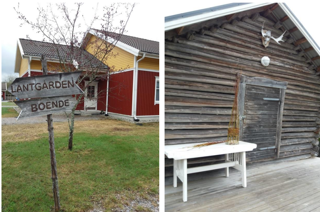
Kuva: Sundomin päivätoimintakeskuksen pihapiiriä

Päivän ensimmäinen kohde Kårkulla samkommun tuottaa palveluja ruotsinkielellä vammaisille ja kehitysvammaisille länsirannikolla ja pääkaupunkiseudulla. Vierailimme Sundomin yksikössä ( Lantgård i Sundom ) Vaasassa, jossa on todella viihtyisä 13 asukkaan palveluasumis- ja päivätoimintakeskus puutarhoineen ja eläimien. Luonnonmateriaaleja hyödynnetään toiminnassa muun muassa hyönteishotellien tekemiseen verstaalla. Lähellä menee metsäpolku, jossa asiakat ulkoilevat kolmesti päivässä. Keskuksessa on kanoja ja lampaita. Keskus on perustettu 1995 ja Green Care -ajattelu on ollut alusta asti ohjaavana tekijänä, vaikka käsite on tullut käyttöön vasta myöhemmin. Keskuksen työntekijät ovat osallistuneet Green Care -hankkeisiin ja -koulutuksiin ja päivittäneet osaamistaan sekä jäsentäneet omaa toimintaa suhteessa Suomessa määriteltyihin käsitteisiin.