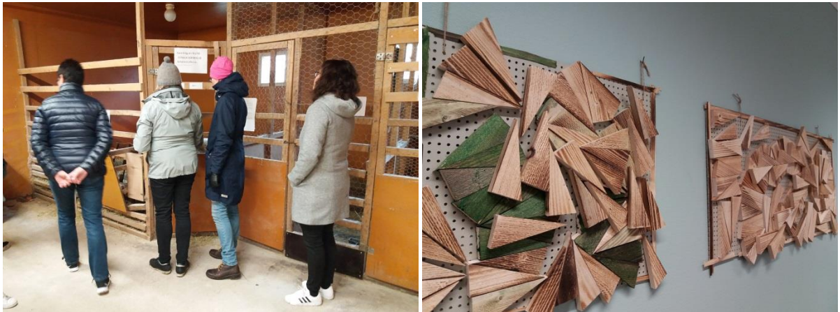
Kuva: Lampola ja kanala sekä taidetta sisätiloissa

Kehitysvammaisten päivätoiminnassa hyödynnetään toiminnallisina menetelminä esimerkiksi kanojen ja lampaiden hoitoa. Luonnonmateriaaleista askarrellaan ja tehdään käsitöitä ja taidetta. Asiakkaat valmistavat myyntiin hyönteishotelleja ja polttopuita. Erittäin siistejä ja viihtyisiä tiloja katsoessa tulee mieleen, että ympäristön esteettisyydellä ei voi olla olematta vaikutusta täällä asuvien hyvinvointiin – niin kotoisa on tämä laitosasumispaikka! Vierailulla tuli myös hyvä ruotsin kielikylpy!