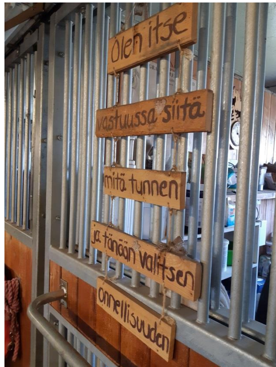
Kuva: Aasi Kaija sopii hevoslaumaan. Sosiaalipedagoginen hevostoiminta on yhtenä Toiskan lastensuojelutyön orientaationa.