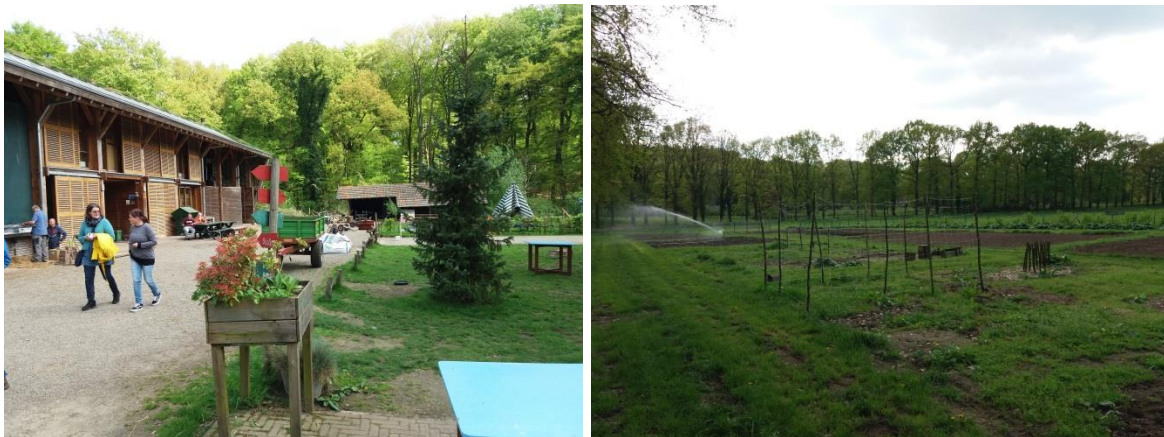
Hoeve Klein Mariendaalissa hyödynnetään viljelyä ja eläinten hoitoa erilaisten asiakasryhmien päivätoiminnassa.