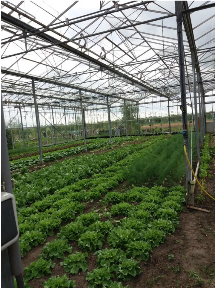
Sateella asiakkaat työskentelevät kasvihuoneessa.