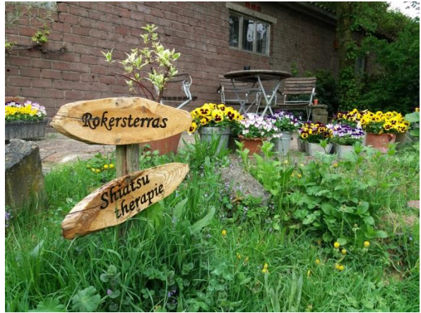
De Paardenmaatn tilalla on käytetty mielikuvitusta, värikkäitä kukkia sekä maalauksia ympäristön koristamiseen.

Toisena päivän kohteena vierailimme Zorgboerderij Hoog-Broek care farmilla, jossa asiakkaina käy ikäihmisiä, koulupudokkaita, kuntoutujia. Tila on luomutila, jonka omistajapari työskentelee maisema-arkkitehtuurin parissa. Työntekijöitä on lisäksi neljä soveltuvan alan ammattilaista. Päivätoiminnassa hyödynnetään ruoan valmistusta tilan omista aineksista. Puitteet ovat viimeisen päälle, asiakastiloissa oli kolme keittiötä, joista yksi toimi myös ravintolana ulkopuolisille. Päivätoiminnan asiakkaat vastaavat ravintolatoiminnasta ja pitopalvelusta. Läheinen retkeilyreitti tuo myös asiakkaita. Tilalla on asiakaskäytössä vuohia, lehmä, sikoja, poneja ja kanoja. Kaikilla tiloilla eläintilat ja -aitaukset ovat todella siistejä. Kulkureitit ja sisätilat ovat esteettömiä. Erilaiset asiakkaat tekevät luontevasti töitä ja viihtyvät yhdessä, jaloissa pyörii koira ja kanoja. Ohjaamista kuvaa lämminhenkisyys ja ihmisen kohtaaminen.