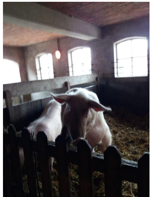
Hoog-Broekissa oli vuohia, lehmä, poneja ja sikoja sekä hedelmäpuutarha ja kasvimaata. Tilalla toimii ravintola upeassa lasikattoisessa rakennuksessa. Ravintolan toiminnasta vastaavat päivätoiminnan asiakkaat.

Kolmas kohde oli Boerderij 't Paradijs. Luomutila on pariskunnan omistama ja heillä on 20 palkattua työntekijää, joista 13 kokopäiväisiä. Lisäksi apuna on 60 vapaaehtoista. Vapaaehtoiset ovat usein eläkeläisiä tai työttömäksi jääneitä tai heitä, jotka miettivät alanvaihtoa. Tilalla järjestetään myöskin