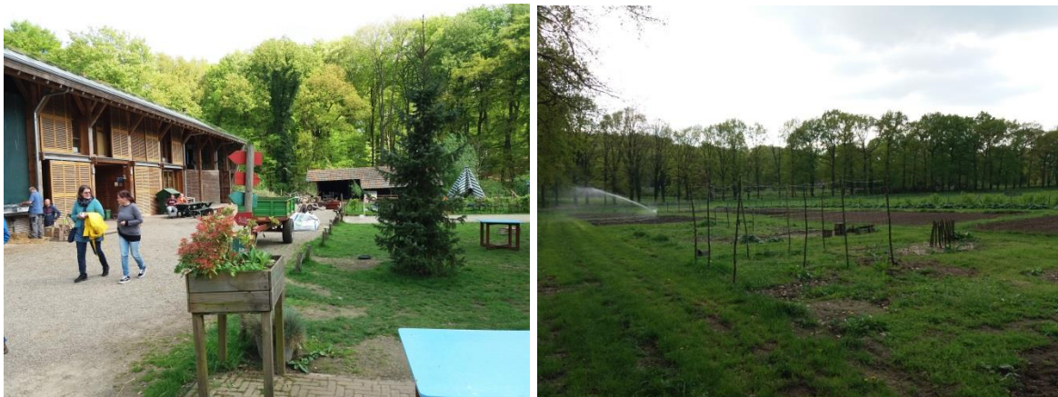
Hoeve Klein Mariendaalissa hyödynnetään viljelyä ja eläinten hoitoa erilaisten asiakasryhmien päivätoiminnassa.