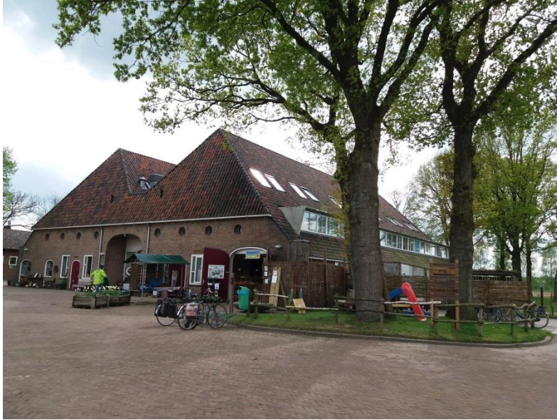
Tilalta löytyy myymälä, majoitustiloja, terapiatiloja, kanala, kasvihuone, peltoa, puutarha, verstaas ja muita tiloja.