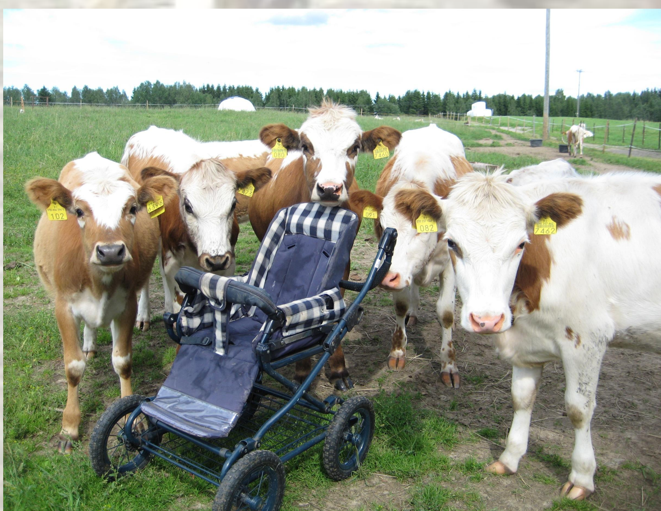
Kuva 1. Hiehojen Novel object ryhmä –testi Seppälässä.