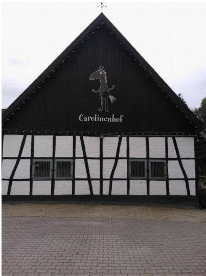
Talli ja logo