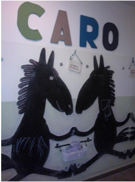
Virike - liitutaulu